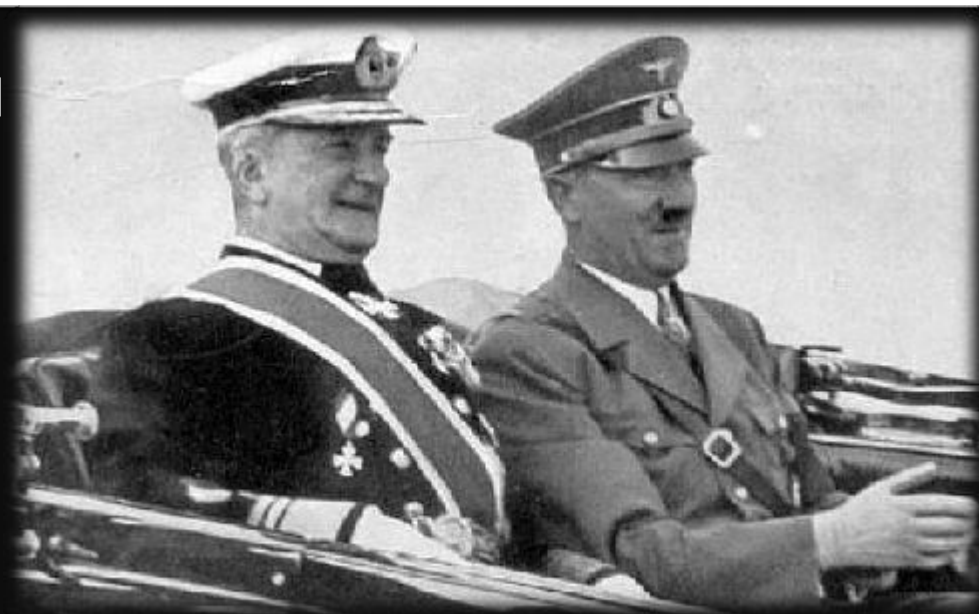
М. Хорти и А. Гитлер